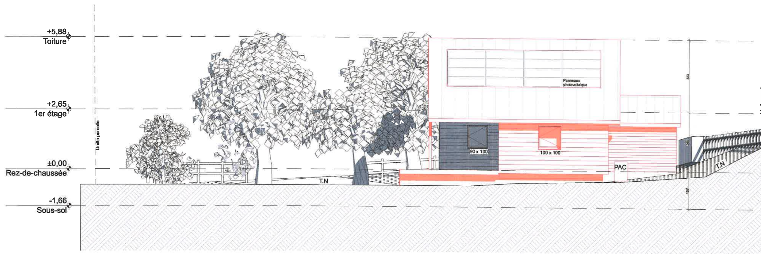
0 Façade Ouest 1:100

EXISTANT A DEMOLIR A CONSTRUIRE No° CAMAC : 249260