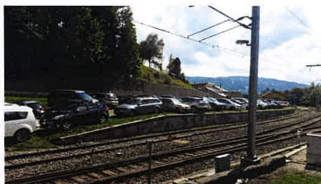
Images du parking des Glacières le dimanche 9 septembre 2018 à 11h00.

Faute de surveillance, nous nous sommes également retrouvés avec un véhicule abandonné, que nous avons dû faire enlever, mettre en fourrière, puis éliminer aux frais de la collectivité. Deux autres véhicules étaient dans le même cas sur le territoire de la commune l'année dernière.