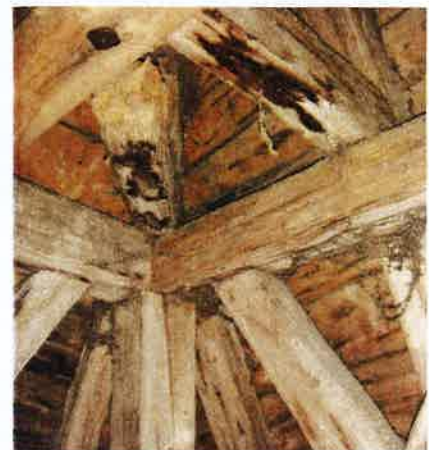
Pièces de charpente abîmées

Les quelques pièces de charpente moisies et des planches seront remplacés par des pièces neuves de même essence. De même pour les volets à claire-voie et les fenêtres des meurtrières en chêne.