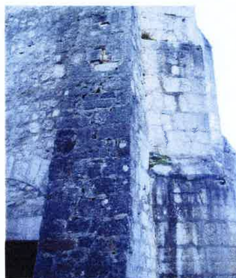
Mousse sur les contreforts détériorant les joints

Les volets à claire-voie en chêne sont en très mauvais état. Ils ne se ferment plus et, de ce fait, laissent entrer l'eau de pluie. Les verres des meurtrières sont tous cassés.