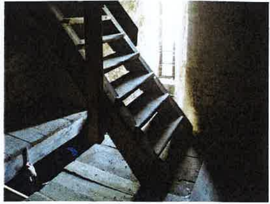
Escalier et fenêtre

Un nouveau plancher devra être construit à l'étage des cloches pour permettre la vue par les ouvertures du dernier niveau. Les volets à claire-voie en très mauvais état seront remplacés avec leur partie inférieure vitrée.