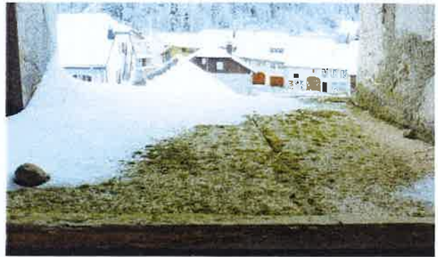
Joints ouverts sur les contrecœurs

La couverture doit être refaite ainsi que le premier lambris. Pour des raisons d'aspect, il est proposé de remplacer l'ardoise par une ardoise de format semblable posé sur un nouveau lambrissage en sapin brut. La petite lucarne sera remplacée en planches de sapin brut. La ferblanterie sera en uginox mat pour faciliter la jonction avec le coq existant, de même que la pose d'un paratonnerre.