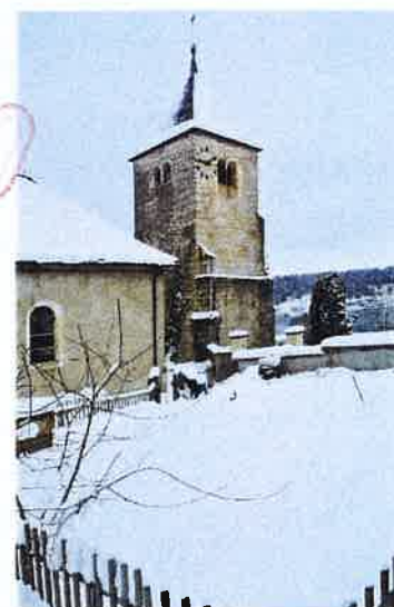
Etat général de la tour