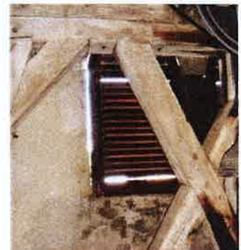
Volet à claire-voie détérioré

Le Service d'archéologie sera contacté avant l'exécution de la fouille périphérique pour paratonnerre.