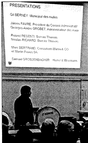
Jeudi dernier, un soixantaine d'habitants du Pont ont suivi avec attention les explications données par les différents intervenants

Les citoyens du Pont, et particulièrement les riverains du lac, savent désormais à quoi s'attendre. Le 3 avril, une séance d'information publique, orchestrée par la Municipalité de L'Abbaye et le Conseil Administratif du village, a permis de se faire une idée du déroulement des travaux. De la réfection de la route à celle de l'éclairage de la rade, le chantier s'annonce long et forcément dérangeant.